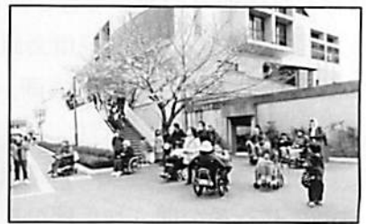
【 ↑ 駅前にて ↓ スロープに行列 】 【 ↑ 尼崎城・展望室で ↓ 】 【 尼崎城をバックにパチリ ↓ ↑ 】